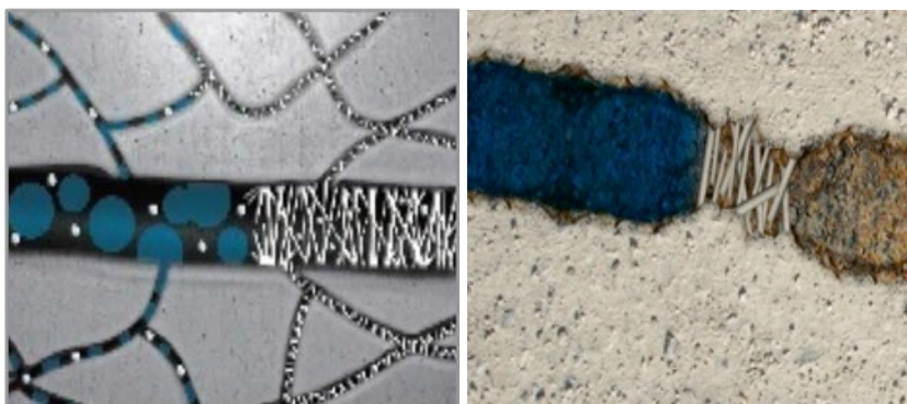
Reproducción interna de la nanocristalización con CONTROL ® INNERSEAL , nanosilicatos de sodio

Esto generará una red nanocristalina interna que aportará al hormigón una durabilidad, aumento de resistencia y protección contra cualquier tipo de ambiente.