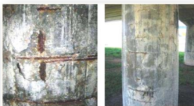
Estructura de hormigón con patologías